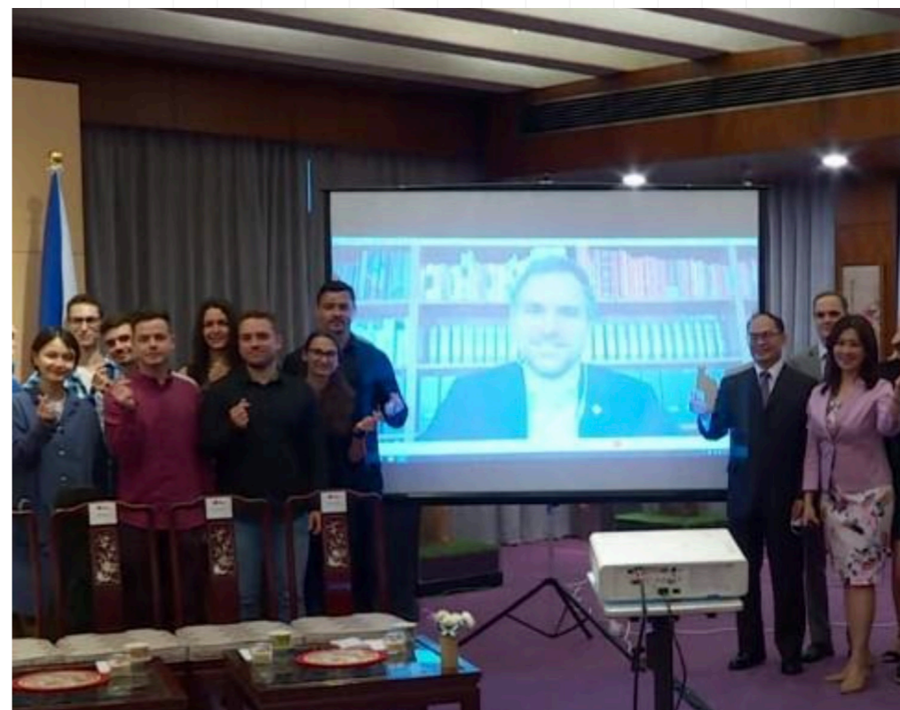
外交部於3月26日舉行「台歐連結獎學金」捷克學生經驗分享會，捷克布拉格市長賀吉普（Zdeněk Hřib）以視訊方式分享其經驗。

經驗分享會由外交部政務次長曾厚仁主持，更邀請曾以實習交換醫生身份來台的布拉格市長賀吉普（Zdeněk Hřib），以視訊方式參加分享會，他以留學台灣的學長身分，勉勵捷克同學珍惜受獎來台的