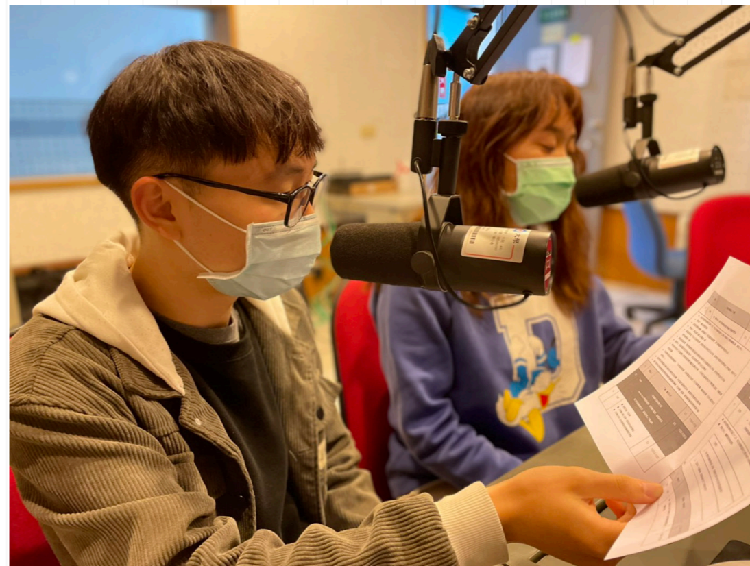
新媒體 Podcast 崛起，許多有想法的學生都投身加入創作行列。

播放平台上，Podcast 的主題五花八門，而這也正是它的特色。主題不受限制，也不拘節目長度，除了 Podcast 錄製者在創作上十分自由外，聽衆也有更多選擇。除了談論主題多元，其產製成本的相對低廉，也是 Podcast 能快速崛起的原因。只要準備收音設備與欲談論的內容，就能錄製節目，因此 Podcast 的錄製者 (Podcaster) 遍布在各個年齡