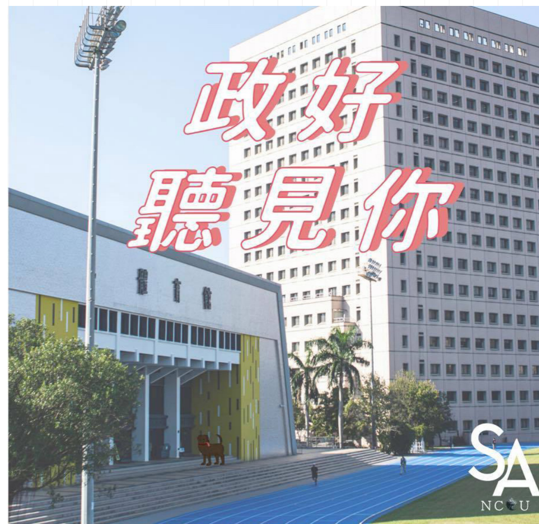
政大學生會 Podcast 《政好聽見你》於 2019 年 12 月底上架，目前已上架 7 集。