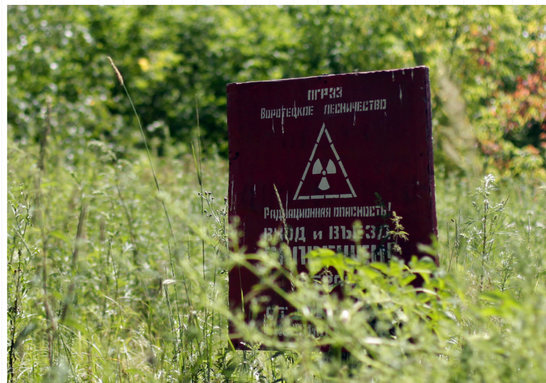
草叢中的車諾比核災區邊界告示。