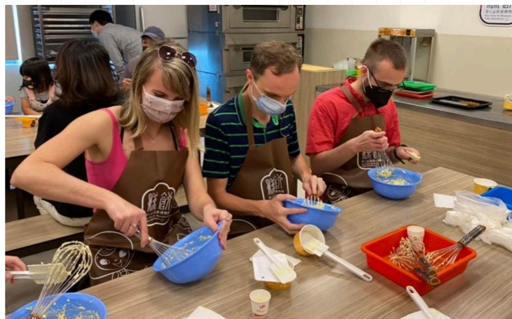
捷克交換生賣力製作台灣鳳梨酥。