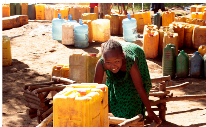
衣索比亞歐莫河下游歐莫拉特鎮，人們忙著在井旁汲水。