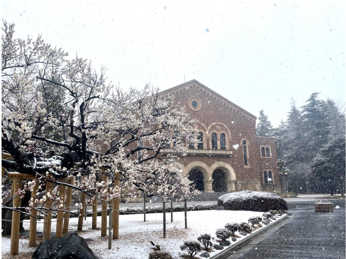
剛好碰到東京難得的大雪，雪中的兼松講堂