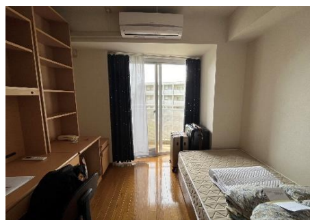
◎我被分配到的 shared room 房型

住宿: 交換生統一住在「小平国際学生宿舍 (ISDAK)」，房型分為 private room 和 shared room 兩種。前者為獨立個室，有自己的廁所，不過廚房、淋浴間、洗衣機烘衣機皆為全樓層共用，要使用的話必須走到室外；後者則類似雅房的概念，原則是六人同住一個空間，除了自己的房間之外，廁所、淋浴間等其餘全部共用。每一間/層宿舍都會有個正規生 CA(Communication Assistant) 或者 RA(Resident Assistant) 負責管理宿舍的共用金等大小事，遇到事情也可以請他們協助。依照我們這屆的情況，半年的交換生似乎都被分配到 shared room，一年的交換生都被分在 private room。