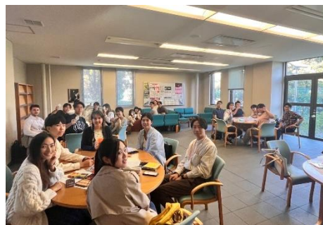
◎一橋的 LC，通常會分英/日文桌進行

這裡的交流機會我覺得算蠻豐富的，ISDAK 每季會舉辦一次 party，可以藉此認識其他交換生。另外，HEPSA (Hitotsubashi University Exchange Program Students' Association, 一個一橋的學生組織) 開學前就會寄信詢問有無參與 buddy program 的意願，學期中也有一些活動 (eg. Lunch Event, Hiking Event) 可以參加，不過後來我和日本學伴只見了一兩次面，之後就沒什麼連絡，是我覺得比較可惜的部分。除此之外，一橋有個 Language Community (LC) 我覺得營運得很不錯，是每周一、三、五中午舉行的語言交流會，推薦想練習外語聽力口說的人可以去參加。