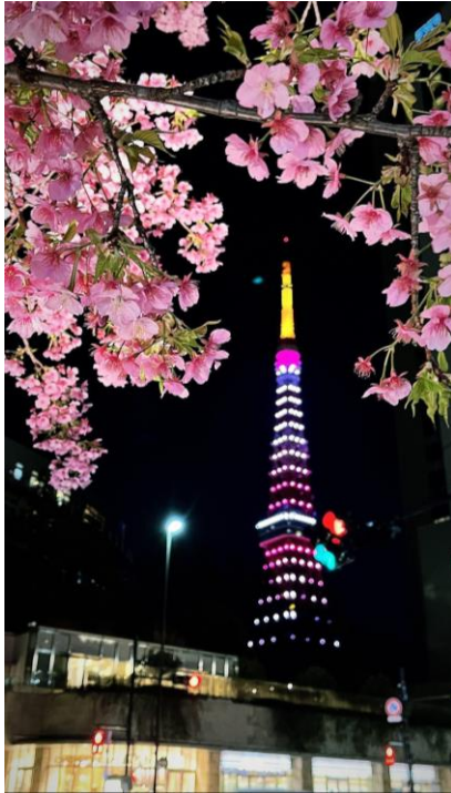
東京二月的早櫻與東京鐵塔