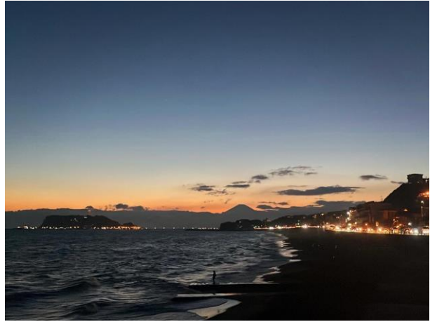
神奈川縣的七里濱海岸，坐在堤岸邊 看日落、遠眺富士山是一大享受