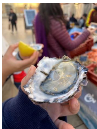
市集老闆請的生蠔