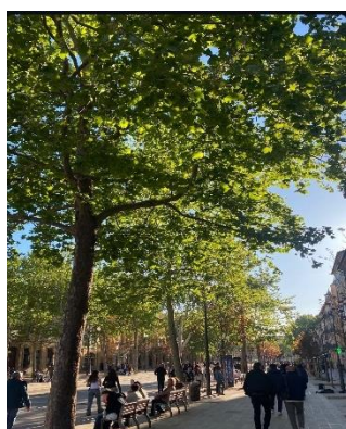
五月的艾克斯市中心

賽，艾克斯是一座大學城，非常安全，我常常半夜一兩點還在外面散步，都是學生和退休的人居多，所以物價跟巴黎差不多，偏高。這個城鎮是一個交換的寶藏地點，我和交換的朋友們都非常喜歡這裡，首先他在南法所以天氣非常好大部分時間都是大藍天，冬天不會下雪而且天氣很舒服，第二、搭車約一個小時就能到馬賽機場、40分鐘到馬賽和TGV站，所以搭地鐵沒多久就可以看到美麗的蔚藍海岸和漁港，最後是這裡的治安堪比台灣，真的很安全。艾克斯本身不是很大，我大部分時間都是用走路的，從宿舍約25分鐘可以到市中心，宿舍門口也有公車可以搭約15-20分一班，因為是小鎮娛樂並不是很多，大部分是和同學朋友自己喝酒聊天，也可以去酒吧街喝酒。