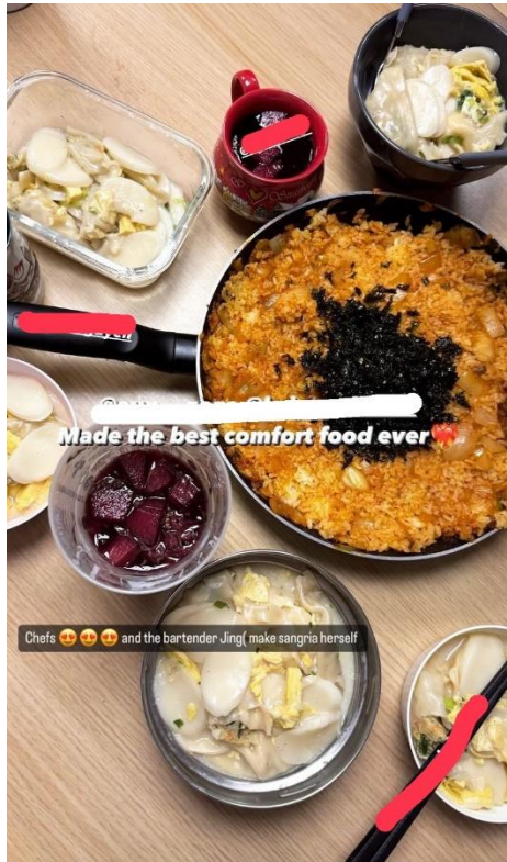
韓國朋友做的晚餐