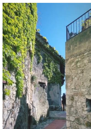
尼斯旁邊的小鎮埃茲