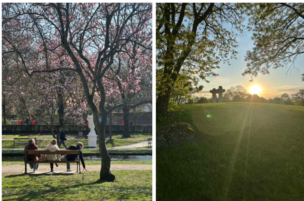
9€ Trier 9€

在宿舍或學校周圍都會用走路的，如果要去市中心，特里爾只有公車，可以直接用google map看公車時間。