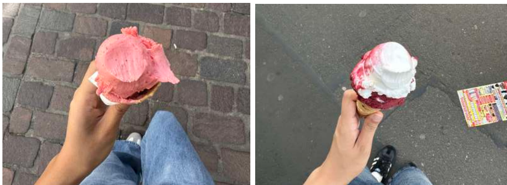
9€ 這間只能付現金 9€

除了吃自己煮的東西，最常吃的是冰淇淋！覺得最好吃的是 這間 ，在主要街道的另一邊，但比裡面的那兩家便宜跟好吃。