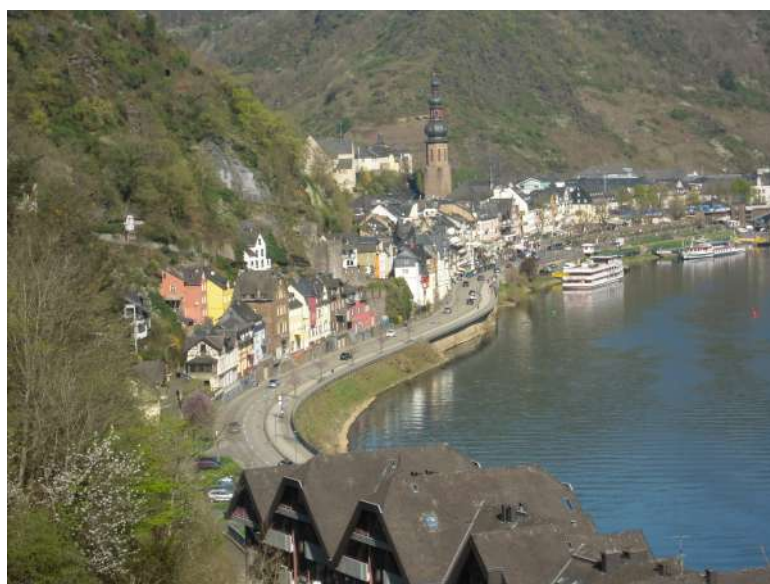
9e Trip to Cochem 9e