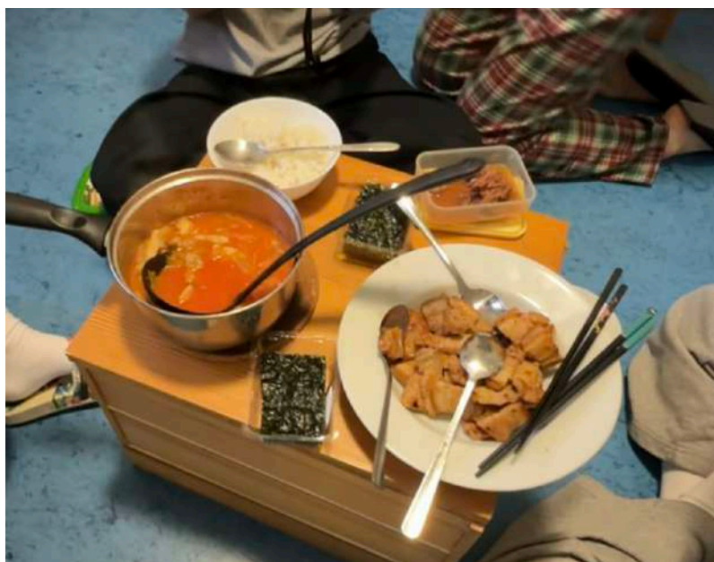
9e 韓式、咖哩 9e

宿舍本身就有廚房，所以大部分的時間都是自己煮，附近也有很多不同的超市。有時候也會去不同朋友住的地方一起吃，煮東西佔交換的時候很大一部分樂趣；)