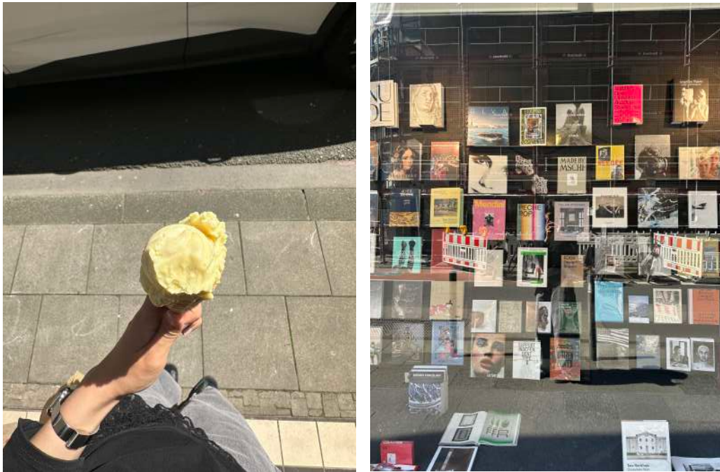
9e Köln 9e

可以趁有semester ticket的時候，多去周圍或可以免費到的地方晃晃，之後應該很難有這個機會 ；；