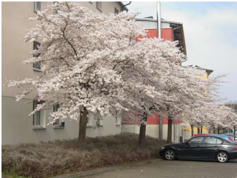
9e 有開櫻花的宿舍 9e

從Petrisberg可以搭公車（大概五分鐘）或者走路（大概15到20分鐘）到學校，宿舍對面就是Lidl、DM跟Wasgau，看過其他兩個宿舍，Petrisberg讚 ～～無聊跟天氣好的時候也可以去散步跟野餐 ❀❀❀