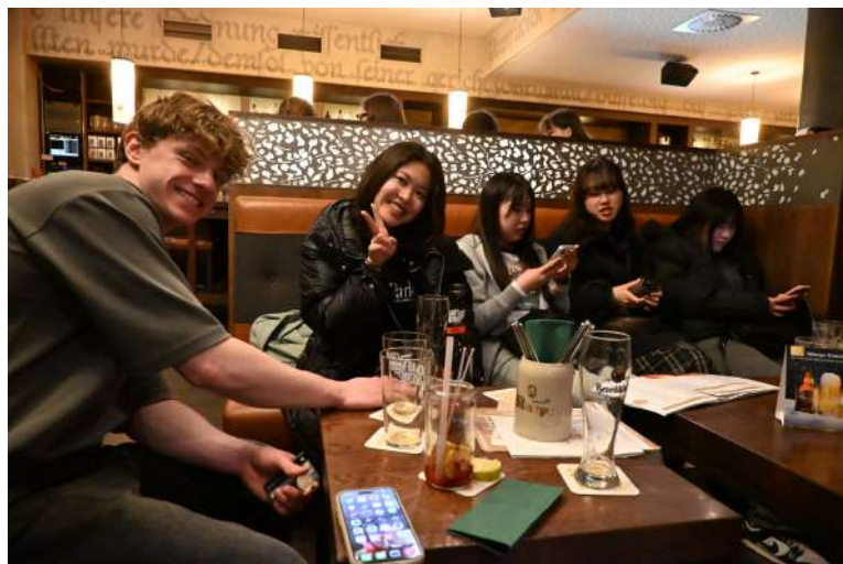
9e 學校辦的bar hopping 9e

從三月到四月中，是特里爾大學交換生的 orientation，每天的早上先上三小時的德文課，下午跟假日會有說明會跟一些活動，像是教大家選課、廣播費、帶大家去入籍、city tour、到周圍的地方trip等。