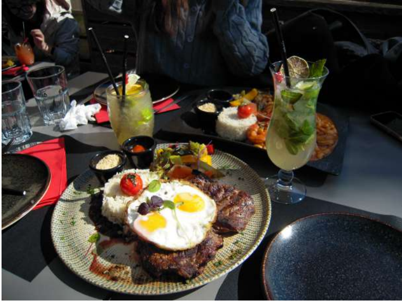
9e Trip to Luxembourg 9e