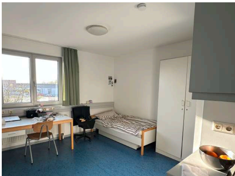
9e 房間 9e

但離開的時候Kleeburger好像要重新翻修，所以之後Kleeburger應該會是最新的！