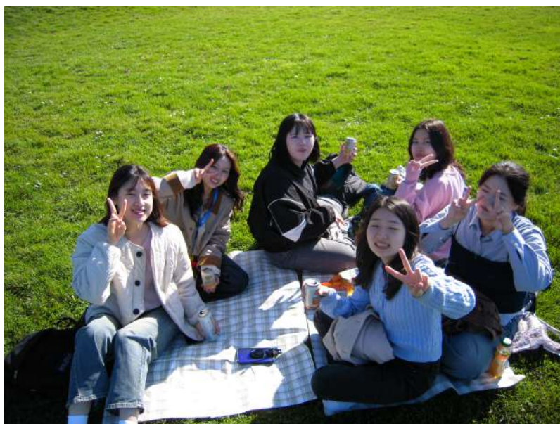
9e 野餐 9e