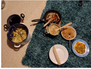
和德國朋友煮飯交流