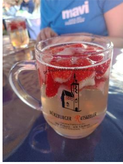
葡萄酒節的草莓酒