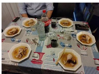
CCM1 Cooking event

上面提到的跨文化管理課分成了 1 和 2，我在上下學期各上了一堂。在跨文化管理 1 中，會有許多機會跟不同國家的同學互動，老師上課會講述一些關於跨文化交流、溝通的內容。課堂中有四次小考，小考的內容取自老師在 Wuecampus(類似政大 moodle 的網站)上傳的資料和文章中。在課堂的最後會有一個叫 Global village 的活動，這個活動由跨文化管理 2 的學生舉辦，跨文化管理 1 的學生需要在活動中利用課程所學來通過挑戰。而跨文化管理 2 的課程內容就像我前面提到的，在一整個學期間籌辦 Global village 來讓 1 的學生參加。在我的經驗裡，跨文化管理 2 會需要花費比其他一般課程更多的時間，因此在選擇該堂課前須要衡量一下自己是否有這麼多時間。