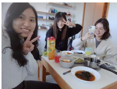
韓國朋友煮韓式料理