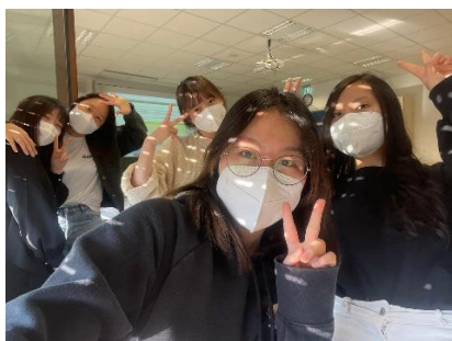
德文課認識的韓國&日本朋友