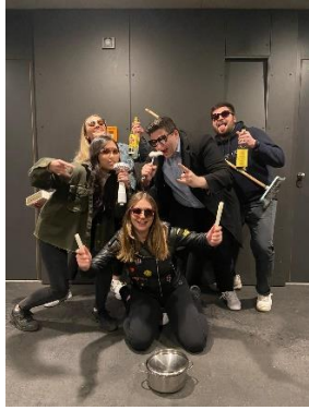
CCM1 Cooking team 拍的 Rock band cover