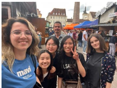
和各國朋友去葡萄酒節&打室外桌球

在課堂報告與德國人的合作，以及在跨文化管理 2 中與不同國家的同學一起籌辦活動，都讓我體驗到不同國家、不同文化的人的處事態度，也讓我學習到要怎麼跟不同文化的人溝通。在德文課中，我也交到許多韓國朋友，讓我對韓國文化更加了解，並可以嘗到他們親手做的韓式料理，我也跟他們介紹了許多台灣的事務和美食。以台灣的外交現況作為德文 B2.2 課程的報告，也讓同學們能透過報告了解台灣的處境，同學的提問也讓我發現外國人對台灣的好奇心。