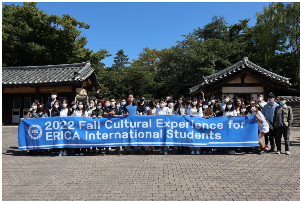
➤ 國際處舉辦的龍山民俗文化村一日遊

六、您對於國合處辦理與該締約學校之間的交換細節，如甄試、薦送、聯繫等事宜，您有無任何建議？