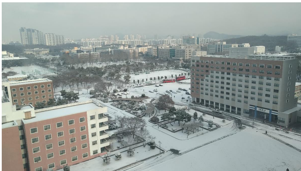
➤ 從宿舍拍攝的校園照，此時正值安山市的初雪

和漢陽大學合作的銀行為新韓銀行，在學校有分行，緊鄰郵局旁，再拿到外國人登入證後，可以先到分行找到行員登記申請戶頭的時段，因為蠻多人都會需要申請的緣故，建議拿到登入證就儘早去登記。在戶頭申辦成功後，行員也會給該戶頭的金融卡，其功能包括提領現金和當現金卡刷卡，非常方便，也可以利用銀行 app 線上轉帳。