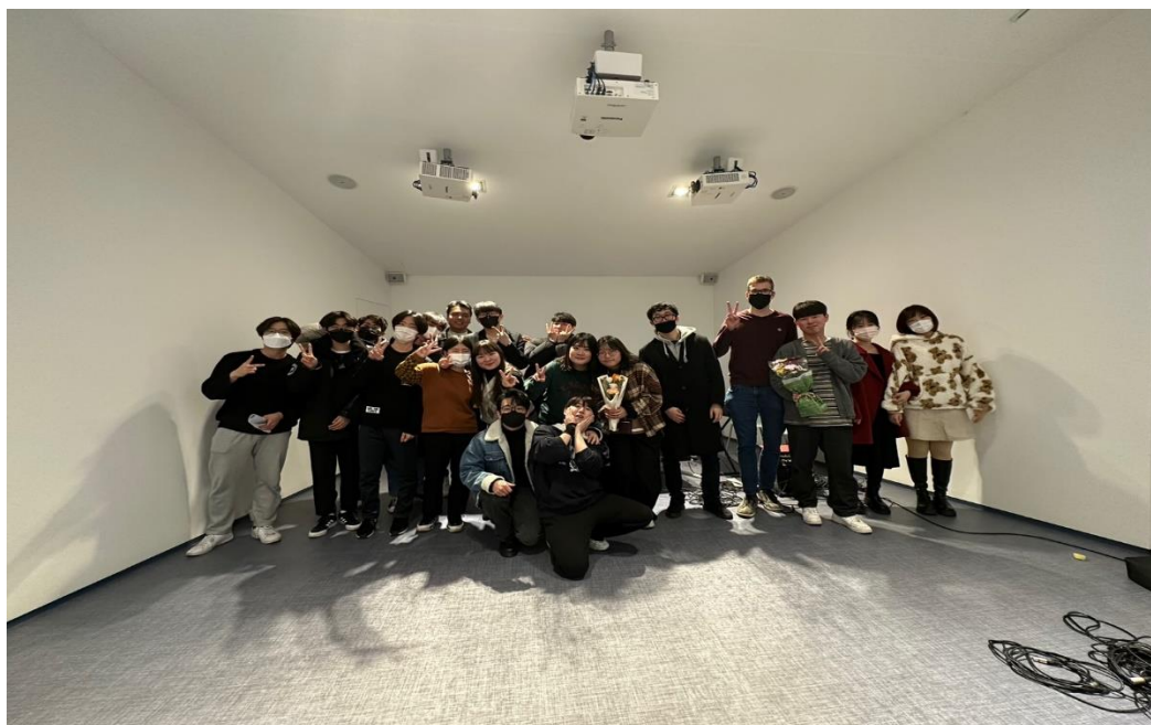
➤ 社內公演完後的大合照

學期末會有社內的成果發表會，屆時可以聽到各組阿卡貝拉和合唱的完整表演，非常有趣。聽學長姐說，以前本來會有學校的公演和校園街頭表演，但都因為疫情而取消。