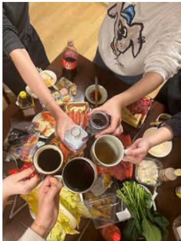
跨年和朋友一起圍爐

和日本朋友的相處比我想像中的容易，雖然一定會有語言沒有辦法即時理解的部分，但我覺得那其實並不妨礙和一個人做朋友的心，如果認真和人交往他肯定能感受到。