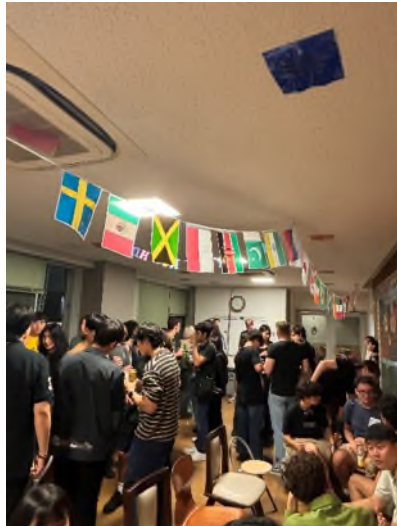
宿舍舉辦的迎新派對

手機網路我是辦理了 ahamo 的 esim 一個月30G 日幣2970元，可以在線上辦理很方便。宿舍和學校內都有 WIFI。