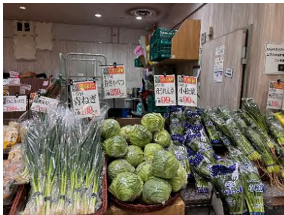
Kyoto Family 裡面的超市