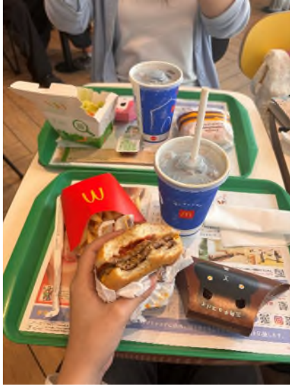
學校附近的麥當勞