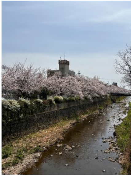
宿舍附近的櫻花樹

飲食:學校的食堂有兩個，9和12號館，12號館就是大食堂像 ikea 餐廳一樣，非常便宜但口味一般，9號館像咖啡廳，餐點稍微精緻一點有每日午餐和定食可以選，不過價格自然比較高一點。學校內也有全家可以買東西吃。周圍餐廳可以參考上面。