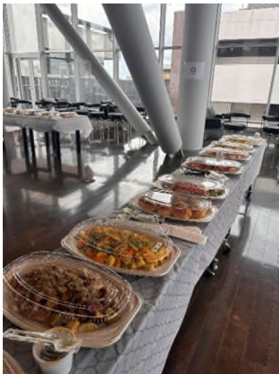
學校國際部舉辦的正式迎新派對