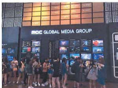
8/22 參訪韓國著名電視公司-MBC 電視台