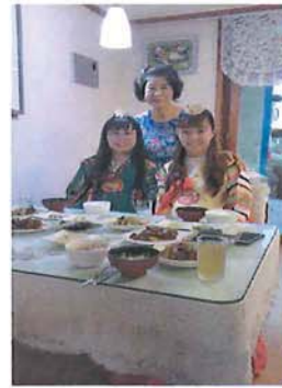
8/18 home-stay 韓國家庭訪問