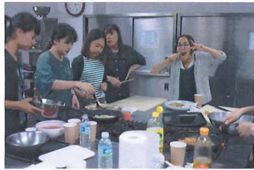
8/15 韓國料理製作 2