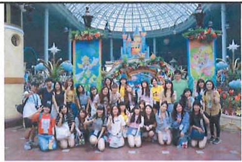
8/24 LOTTE WORLD