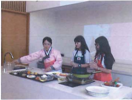
8/ 15 韓國料理製作 1