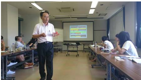
吉中信人老師授課