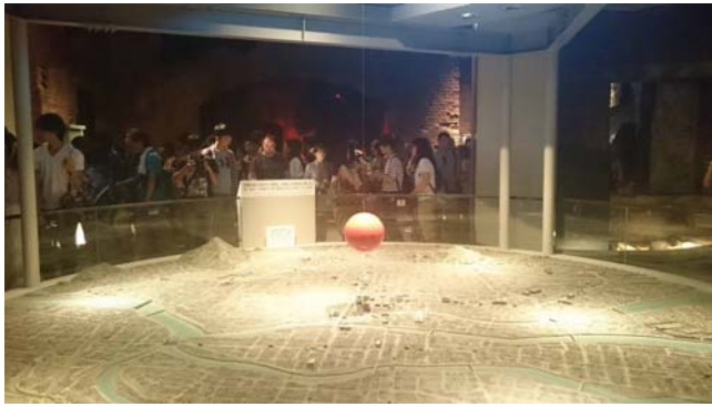
參訪廣島平和紀念資料館