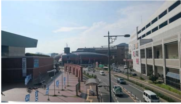
參訪吳市大和博物館