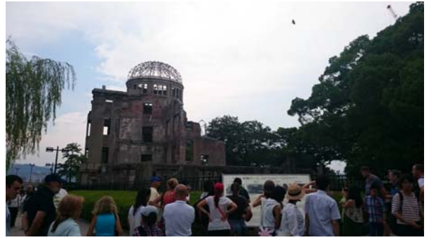
參訪廣島原爆遺跡